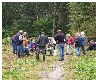
Soms is er koffie. Nee, niet altijd.