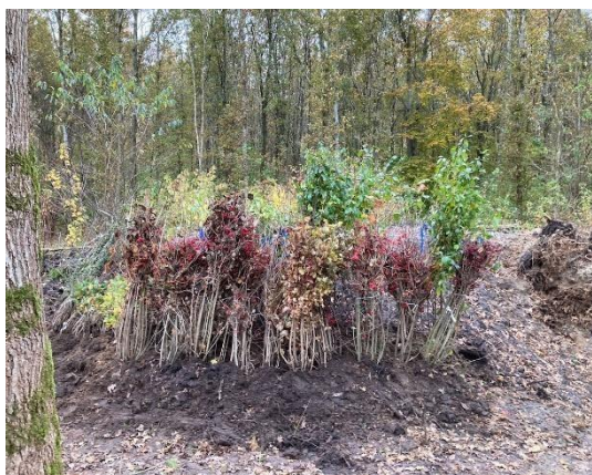
Deze struiken moeten 12 maart de grond in.